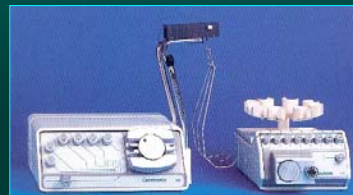
Miscelatore automatico Caretronic